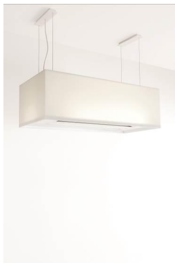
Zen Hood by Novy

Per il Dutch Satellite, infine, lo studio Lotte Douwens ha realizzato 'Table Landscapes', un sistema di vassoi pensati per sovrapporsi e intrecciarsi sulla tavola, creando una gerarchia di piani dinamica e molto colorata.