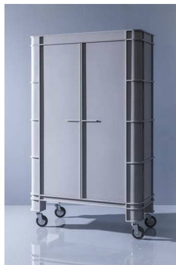
Grey on Gray by Visser & Meijwaard