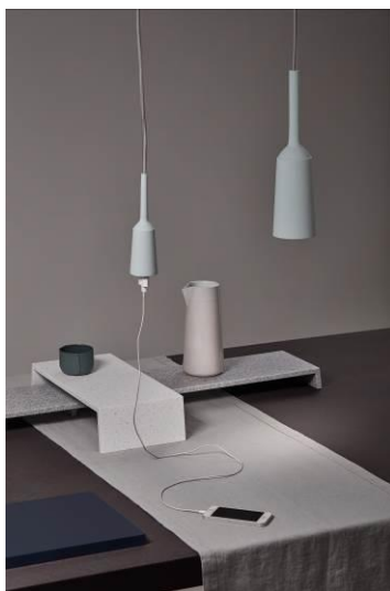
Landscape Tables by Lotte Douwens