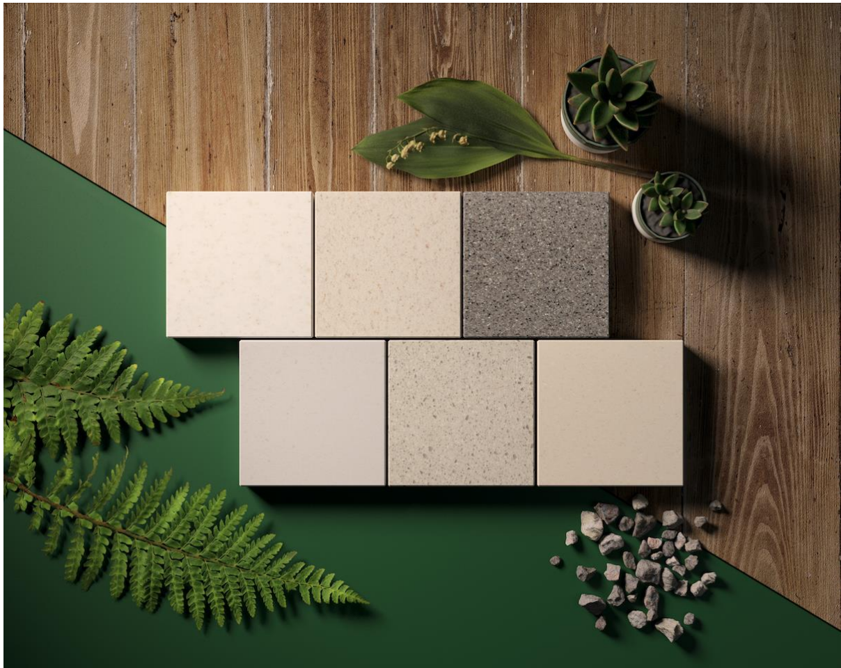
Collezione HIMACS Colori riciclati

Questa collezione è riconosciuta dal certificato Greenguard Gold Indoor Air Quality e contribuisce a ottenere crediti LEED® (Leadership in Energy and Environmental Design) per un design sostenibile.