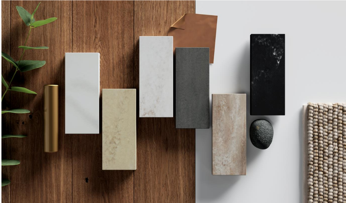
HIMACS Aurora Colours

HIMACS, together with Derve, the official distributor for the Veneto and Friuli-Venezia Giulia regions, is among the exhibitors at the forthcoming Sicam event, with a stand and materials display designed to present to the public the brand's most recent and innovative collections.