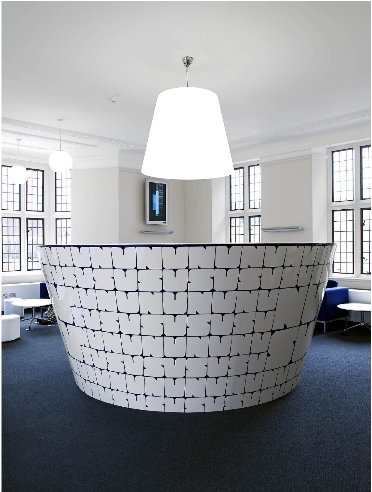
HI-MACS® Nordic White torneado con CNC.