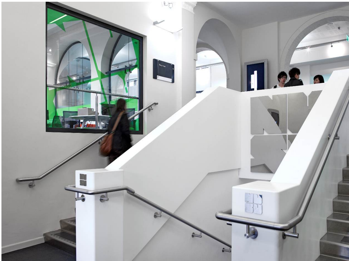
Vista del revestimiento de las escaleras.

Uno de los principales retos de FaulknerBrowns y de los fabricantes Multi-Surface Fabrications (MSF) de County Durham fue que la remodelación se llevaba a cabo en un edificio protegido, por lo que toda la estructura debía permanecer intacta. La escalera principal, por ejemplo, debía conservar sus características originales, por lo que un revestimiento en HI-MACS® se impuso como la mejor opción.